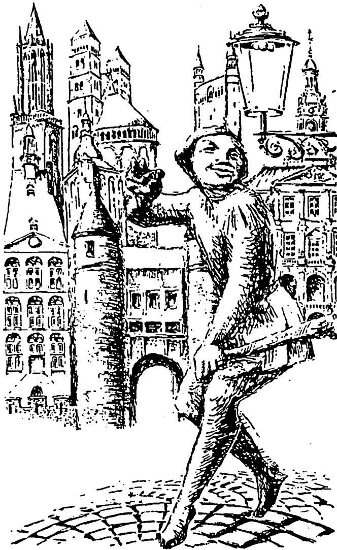
D'n ierste kiebitzer